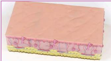
Après le traitement – épilation permanente